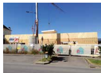
Luxemburger Langhaus als Vorbild