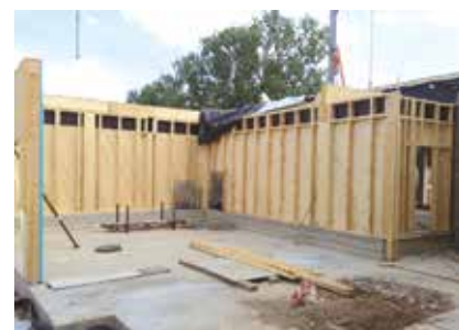
Aussteifung mit Diagonalplatten