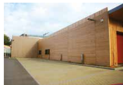
Rhombusschalung aus Weißtanne