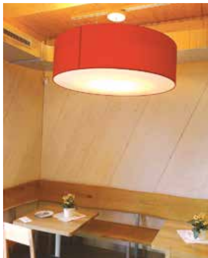
Holzbau auch im Bistro

Architektur: hainarchitektur Holzbau: Holzbau Henz GmbH Geschäftsfläche: 557 m 2 Verkaufsfläche: 377 m 2 Heizwärmebedarf: 64 kWh/m 2 a = Wärmeschutzklasse C Primärenergiebedarf: 28 kWh/m 2 a = Gesamtenergieeffizienzklasse A hierzu: Wärme aus Kühlung darf nicht berücksichtigt werden Luftdichtheit: 1,18 1/h Baukosten: 1 Mio. Euro