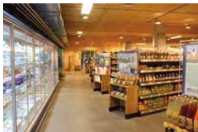
Die Abwärme der Kühlregale speist die Fußbodenheizung

daches zu gewährleisten, wird die Frischluft aus der Lüftungsanlage des Supermarktes durch die Lüftungsebene der Dachkonstruktion angesaugt. Ein Bypass verhindert dabei, dass im Sommer etwaige hohe Luftfeuchtigkeit in der Lüftungsebene kondensiert. Zur Absicherung messen an exponierten Stellen Sonden permanent Feuchtigkeit und Temperatur und verhindern somit eine potenzielle Aufwechung des Daches.